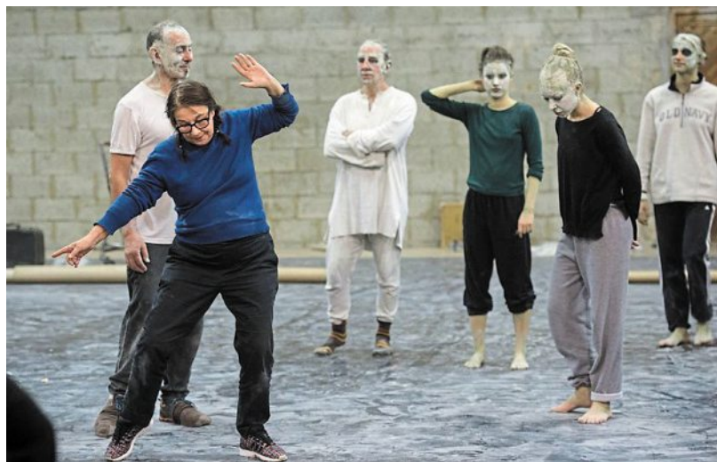
Un documentaire sur la chorégraphe Maguy Marin sera diffusé au cinéma L'Entracte à Falaise.

santé, des artistes en résidence à l'IME (Institut médico-éducatif) et l'Essor de Falaise ont travaillé ou créé des pièces qu'ils reproduiront in situ. « Ce sont des spectacles comme