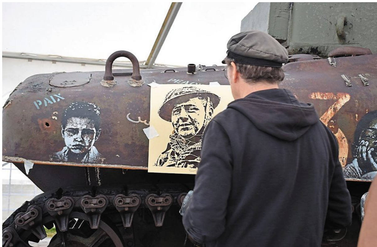
Les visages ont commencé à prendre forme sur le char Sherman installé devant le Mémorial de Falaise.

De nombreux badauds viennent jeter un coup d'œil à ce char. Chacun observe l'artiste apposer sa marque.