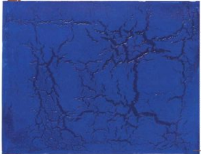
Philippe Pastor, Série «Bleu Monochromes» (12,078 BML, 2012, 162 x 130 cm.

L'artiste utilise des matériaux vivants et les transforme en faisant du temps et de son environnement immédiat un allié ; il mélange la terre, les pigments, les minéraux et plantes de toutes sortes, représentant ainsi sa vision de la vie, de la destruction de l'environnement et le rôle de l'Homme dans la société. «J'essaie d'être au plus près des choses en les ressentant le plus possible. Mais c'est