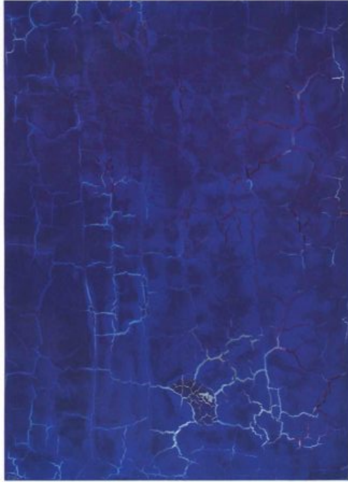
Philippe Pastor, Série «Bleu Monochrome» (12.025 BM), 2012, 1,30 x 1,83 cm.